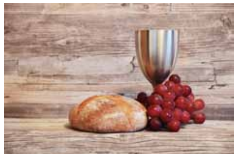
N. Schwarz © GemeindebriefDruckerei.de

Wir bitten um Verständnis, dass wir wegen der Coronabeschränkungen und des dadurch sehr begrenzten Platzangebotes, Gottesdienst im Wesentlichen nur mit den Konfirmandinnen und Konfirmanden und deren Angehörigen feiern können.